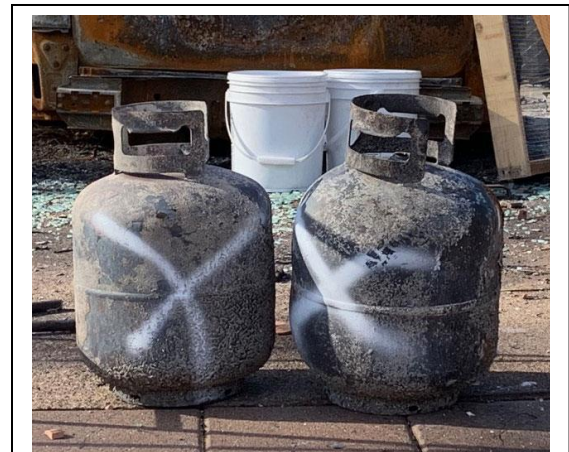
Các thùng rỗng, được đánh dấu bằng sơn trắng, sẽ được thu dọn trong Giai đoạn 2.

Không. EPA sẽ chỉ loại bỏ chất thải nguy hại. Nếu họ tìm thấy vũ khí hoặc nghi ngờ tìm thấy hài cốt, EPA sẽ ngừng công việc ngay lập tức và liên lạc với Cảnh sát trưởng của Quận Hạt. Không có đồ vật nào khác sẽ bị loại bỏ.